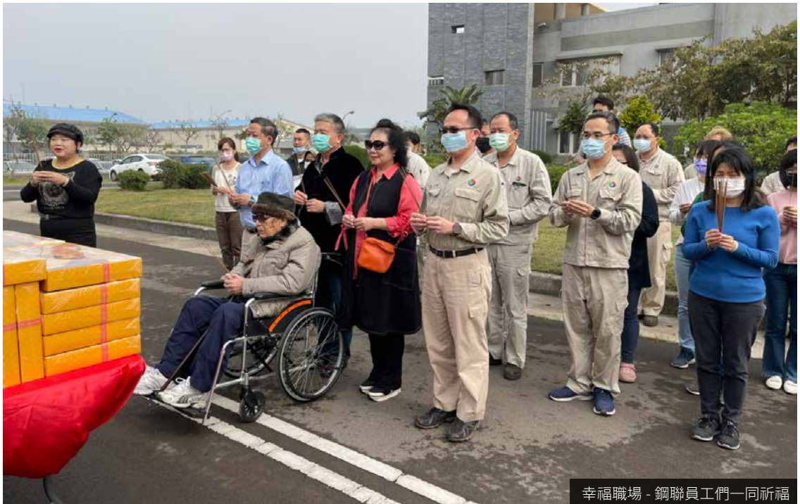
幸福職場 - 鋼聯員工們一同祈福

薪資待遇上不因性別或族群有差異，相同職位、職等之新進人員女男員工基本薪資 比例為 1 : 1